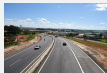
Duplicação da SP-101

A primeira etapa de ampliação da rodovia Jornalista Francisco Aguirre Proença (SP 101) – que liga Campinas a Capivari – foi concluída e entregue em maio de 2013 com 3,24 quilômetros de vias duplicadas (km 11+400 ao 14+640), dispositivo de acesso e retorno no km 13+500, duas passarelas e quatro pontos de ônibus, com investimento total de R$ 11,6 milhões.