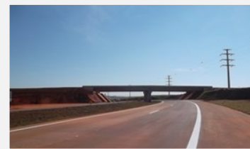
Contorno de Piracicaba

Com início em abril de 2011, o Contorno de Piracicaba irá inserir o município em uma nova e importante realidade, já que é uma mudança esperada há mais de 20 anos pela população. Com 9 quilômetros de extensão a obra melhorará significativamente o tráfego na região, já que parte dos caminhões terá outra opção de trajeto, por fora do município. A mudança facilitará também o escoamento de produções e aumentará a fluidez dos veículos da cidade.