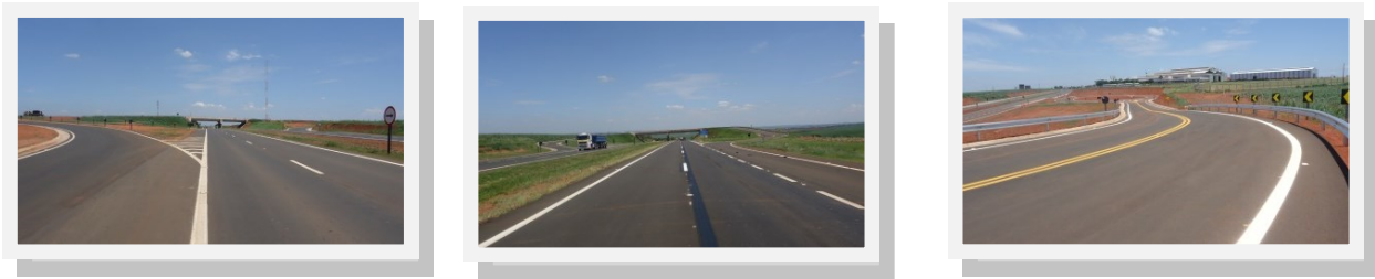
Duplicação da SP-308

A duplicação da Rodovia Comendador Mário Dedini (SP 308), que liga Salto a Piracicaba ocorrerá em 2 etapas. A primeira teve início em 2012 e com término previsto para Abril de 2015. Compreende o trecho entre Piracicaba e Capivari, com 25,8 quilômetros de duplicação (dos quais 18 quilômetros já foram entregues em agosto de 2014), além da construção de seis dispositivos de acesso e retorno, com investimento já realizados de R$ 80 milhões. O segundo trecho terá início em 2015 e término previsto para 2017, cinco anos antes da data prevista no Contrato de Concessão (2022).