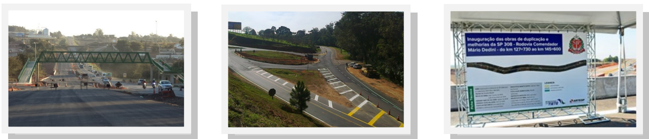
Demais Obras em Andamento.

A duplicação da Rodovia Comendador Mário Dedini (SP 308), que liga Salto a Piracicaba ocorrerá em 2 etapas. A primeira teve início em 2012 e com término previsto para Abril de 2015. Compreende o trecho entre Piracicaba e Capivari, com 25,8 quilômetros de duplicação (dos quais 18 quilômetros já foram entregues em agosto de 2014), além da construção de seis dispositivos de acesso e retorno, com investimento já realizados de R$ 80 milhões. O segundo trecho terá início em 2015 e término previsto para 2017, cinco anos antes da data prevista no Contrato de Concessão (2022).